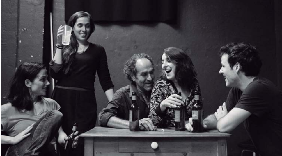
Sota la ciutat (2015) suposa un avenç artístic perquè amplia els seus interessos amb una organització dramàtica més clàssica, i perquè per primera vegada una obra seva és representada en un teatre públic —el Lliure— i dins una temporada regular.

el pes. El pes de milers d'anys. El pes dels morts i dels... I només em sento lleugera. No m'ho puc treure de dins. No m'ho puc treure. No m'ho puc treure. I crec que potser expressant-t'ho... si ho expresso... almenys una part... potser... I em veig a mi mateixa dient-te que ho facis veure, que no cal que sentis, però que ho facis veure, que no cal que ho sentis, però que ho facis veure, que ho facis veure, que ho facis veure... Hem de plorar realment els morts. No només els nostres. Els morts. Saber plorar-los. Saber sentir la seva absència.»