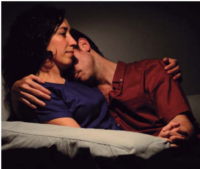
L'última nit del món representada aquesta vegada per Flyhard Produccions, és una adaptació personal de textos narratius de ciència-ficció.