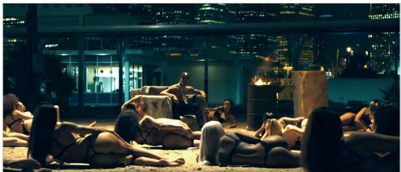
Imagen 5. Videoclip 'Sicko mode', de Travis Scott, 2019 [00:02:00].

La masculinidad protestante occidental, por su parte, está asociada directamente a los géneros musicales del hip hop y el rap. Este resultado va en línea con otros trabajos donde se discute la construcción del imaginario negativo en torno a estos géneros musicales (Schneider, 2011; Connell, 2014), sobre todo por su vinculación con escenarios de clase trabajadora o personajes racializados (Poynting; Noble; Tabar, 2011). La tabla 2 refleja un ejemplo en 2009, mientras que en 2019 este estereotipo tiene mayor presencia (n=4). Como particularidad se destaca que esta representación se encuentra interpretada en solitario, ya sea como solista o en grupo sólo de hombres. Pese a que existe un ligero matiz con respecto al estereotipo de masculinidad híbrida occidental, en la canción 'Options' de NSG ft Tion Wayne, el estereotipo protestante continúa siendo dominante. Los videoclips que se encuentran en esta categoría son 'Strike a pose', de Young T & Bugsey ft Aitch, 'Sicko mode' (ver imagen 5) de Travis Scott, y 'Right round' de Flo Rida.