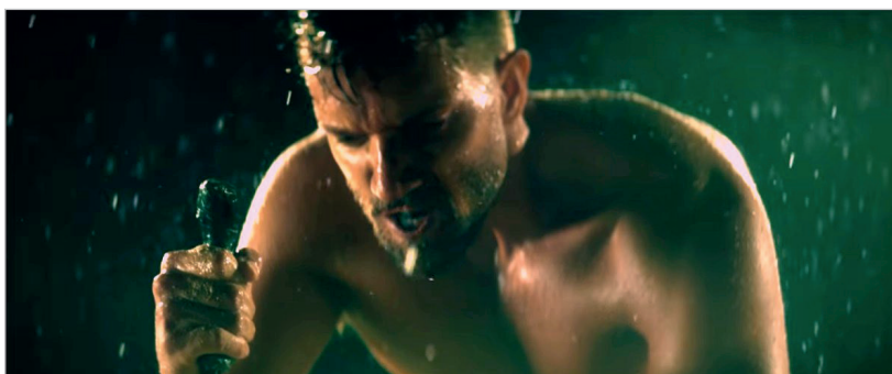
Imagen 7. Videoclip 'Tabú', de Pablo Alborán y Ava Max, 2019 [00:02:43].

En este mismo tema musical encontramos la única representación de masculinidad sissy , en Lil Nas X (ver imagen 6), quien es trascendental para determinar la representación positiva de la masculinidad, sobre todo dentro de un género musical generalmente controvertido como es el rap. La masculinidad trans no se identifica dentro del estudio.