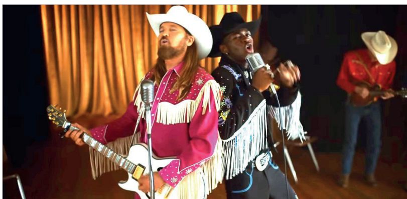
Imagen 6. Videoclip 'Old town road', de Lil Nas X ft Billy Ray Cyrus, 2019 [00:02:05].

con un incremento en el último periodo. Los videoclips de Milow 'Ayo technology' y 'Antes de que cuente diez' de Fito & Fitipaldis son los ejemplos clave en 2009. Mientras que, para 2019, los videoclips representativos son 'Old town road' de Lil Nas X ft Billy Ray Cyrus, 'Ladbroke grove' de AJ Tracey y 'Wow' de Post Malone. Curiosamente, cuatro de los cinco vídeos corresponden al género musical del rap (o rap fusión). El estudio sostiene que una característica clave para explicar esta relación se encuentra en la configuración de la representación y narrativa, pues el humor, la sumisión del varón o la declaración de valores personales transforma lo que podría anticiparse como una masculinidad hegemónica o protestante (debido a la connotación social del género musical), en una masculinidad híbrida ( Bridges; Pascoe, 2014 ). Un ejemplo de esta lectura está en el videoclip 'Old town road' donde, entre el estilo country de Billy Ray Cyrus, la vestimenta vaquera rosa y la coreografía de salón, se teje una representación que difiere de la cosificación constante que el género del rap suele tener como ingrediente de su representación.