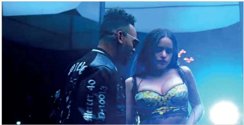
Imagen 4. Videoclip 'Tu x mi, yo x ti', de Rosalía y Ozuna, 2019 [00:02:24].

La feminidad híbrida occidental corresponde al estereotipo que más se homogeniza en ambos periodos de tiempo, es decir, que no sufre un cambio sustancial en su cantidad de representaciones. Tanto en 2009 (n=4) como en 2019 (n=3), esta categoría se vincula sobre todo con el género musical pop (y con sus variantes: pop country, pop rock, pop indian), con la única excepción en 2019 en la figura de Rosalía y su tema de reggaeton