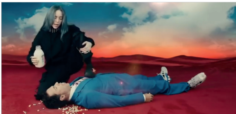
Imagen 3. Videoclip 'Bad guy', de Billie Eilish, 2019 [00:01:29].