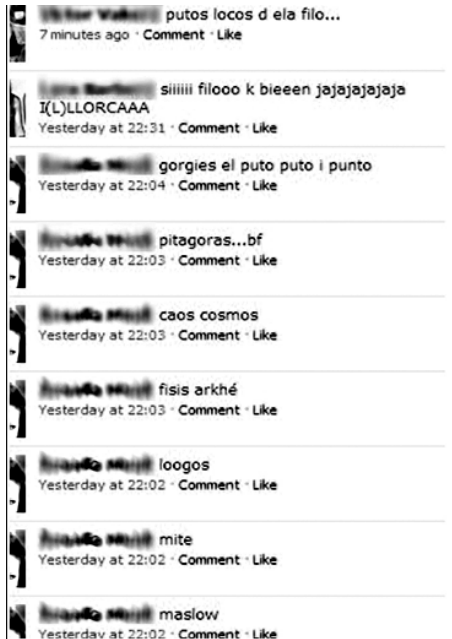
3. Captura de pantalla «Un atac filosòfic al facebook del Jaime».

Un segon tipus d'humor força freqüent entre els estudiants és aquell que consisteix a ridiculitzar el significat de les paraules cultes o utilitzar-les de manera creativa i sorprenent. Vegem-ho a través d'un exemple concret extret del facebook del Jaime: