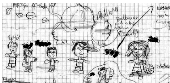
1. Caricatures dels membres de la colla dibuixades per l'Arnau, extretes de la historieta «Un día en la playa».

Els protagonistes d'aquesta ponència són quatre estudiants que, entre els anys 2006 i 2010, formaven part d'una colla d'un institut cèntric de Barcelona. El que unia a aquests joves era que estaven «enganxats al riure». El dibuix següent (imatge 1), fet per l'Arnau 1 un dia a la classe de música, ens serveix per presentar el grup. Les caricatures focalitzen i magnifiquen alguns dels trets distintius de la personalitat de cadascun dels membres del grup.