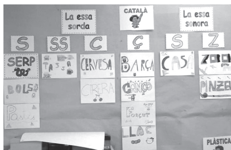
► Murals per a les paraules model de les grafies corresponents a [s] i [z]

Les paraules model escollides són un referent per a l'aprenent en totes les pràctiques de lectura i escriptura. Se li recomana que quan tingui un dubte, acudeixi "mentalment" a la seva paraula model per resoldre'l. A l'aula de quart, les paraules model es van recollir en forma de murals.