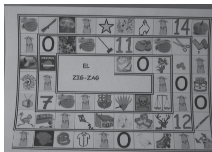
▼ Tauler del zig-zag

Des del moment inicial vam considerar escaient incloure una metodologia lúdica. És evident que a tothom li agrada jugar i, per tant, pensàvem que els alumnes respondrien molt bé davant d'aquesta dinàmica. Exposem dos dels jocs que vam utilitzar. El primer és el zig-zag , un joc ideat amb els objectius de distingir els sons corresponents a la essa sorda i a la essa sonora, i alhora conèixer les grafies que representen el so de la essa sonora. El joc consisteix en una mena de joc de l'oca en el qual els alumnes avancen dues caselles, si cauen en una imatge que conté essa sorda, o tres si ho fan en una que conté essa sonora. Per tant, ells mateixos han de descobrir si la paraula en qüestió conté un so o un altre i al mateix temps, anotar-la en una graella preparada per a l'ocasió.