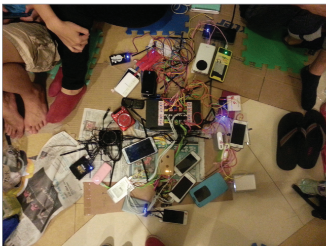
Figura 2. Punto de carga de dispositivos móviles en Admiralty, Hong Kong.

Las ocupaciones del Umbrella Movement , también conocido como Occupy Hong Kong y Occupy Central , comenzaron el 28 de septiembre de 2014 en las principales calles de los barrios de Admiralty, Mong Kok y Causeway Bay de Hong Kong. La ocupación estaba prevista para el 1 de octubre pero se avanzó tras la detención de varios estudiantes que intentaban llegar a las dependencias del legislativo autónomo. En las protestas participó el movimiento Occupy Central