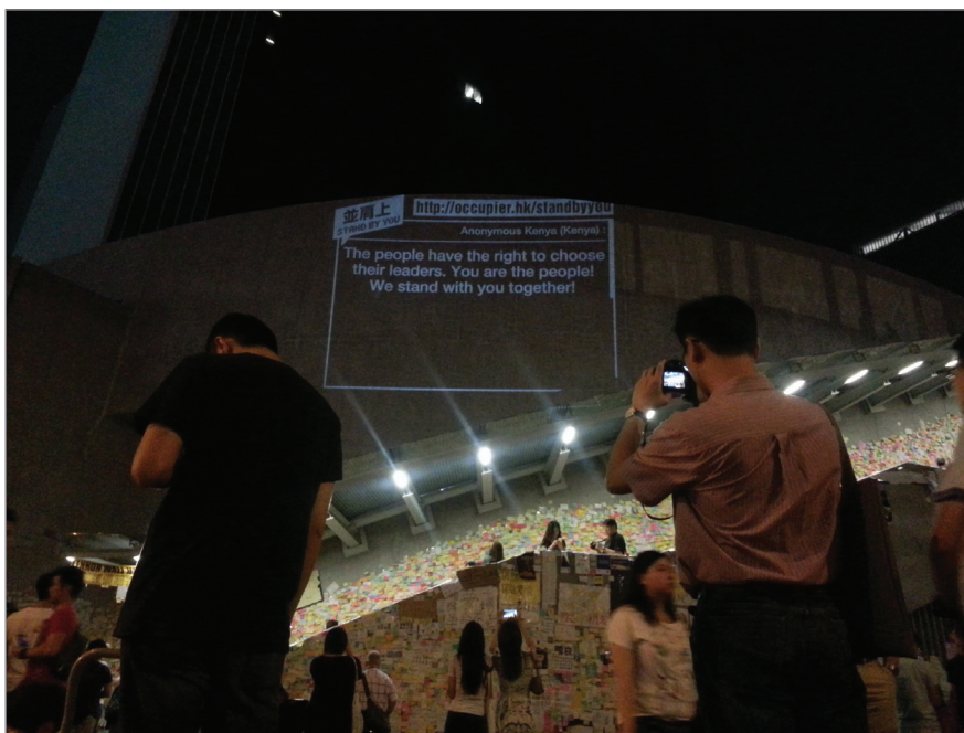
Figura 1. Proyección de mensajes de solidaridad internacional enviados a través de internet.

with Love and Peace , del que formaban parte la Federación de Estudiantes Universitarios y la asociación de alumnos de secundaria Scholarism . Su objetivo era conseguir retirar la reforma electoral del Congreso Nacional del Pueblo y mayor libertad en la elección de los candidatos. La polémica reforma preveía el sufragio universal en Hong Kong desde 2017 pero definiendo que los candidatos tengan que contar con la aprobación de un comité de 1.200 notables, sin posibilidad de que los ciudadanos puedan proponer nombres directamente.