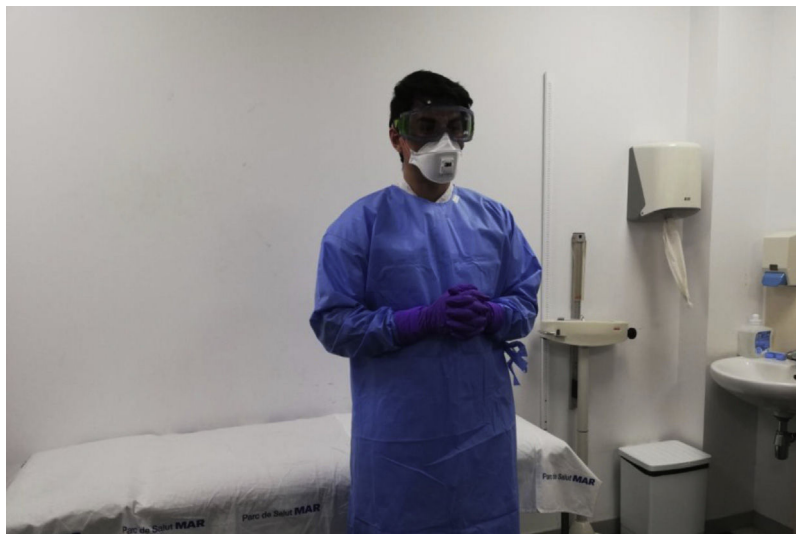
Figura 3 – Solo en caso de que se vayan a producir aerosoles (administración de nebulizaciones, ventilación mecánica, fibrobroncoscopia, intubación orotraqueal, aspiración de secreciones, etc.) se requiere máscara FFP3 (con válvula de exhalación) y gafas de protección completa. Se recomienda que todo el material sea desechable. Si no se dispone de manga larga, utilizar la bata de aislamiento (verde) y añadir un delantal de plástico.

desconecta, ayuda al paciente a entrar y salir de la habitación y limpiar la habitación. La misma bata de aislamiento no debe usarse para el cuidado de más de un paciente, excepto si están aislados juntos (aislamiento de cohortes).