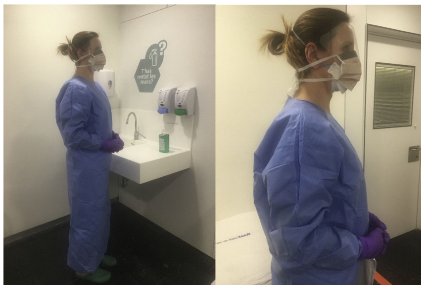
Figura 2 – Equipo protector individual (EPI) para coronavirus. Consta de un par de guantes de nitrilo de manga larga sin polvo, bata larga impermeable, máscara FFP2 y máscara quirúrgica con pantalla completa. Esta lista de equipos de protección individuales se encuentra en revisión permanente dependiendo de la evolución y la nueva información disponible de la enfermedad de SARS-CoV-2.