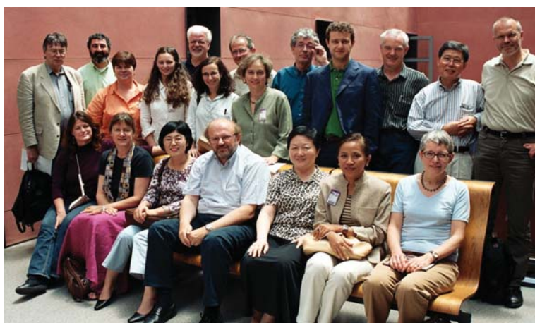
COMITÈ CIENTÍFIC DE LA XARXA PCST

Finalment, en el seminari "Periodisme Científic en un Món Divers" es va reflexionar sobre el paper del periodisme científic. Va tenir lloc els dies 7 i 8 de juny a l'auditori de l'edifici Rambla de la UPF. John Noble Wilford, creador del suplement Science Times del diari The New York Times i guanyador en dues ocasions del premi Pulitzer, va pronunciar-ne la conferència inaugural. El seminari estava organitzat per la Fundació Espanyola de Ciència i Tecnologia i l'Observatori de la Comunicació Científica, amb la col·laboració de l'Associació Catalana de Comunicació Científica i l'Associació Espanyola de Periodisme Científic.