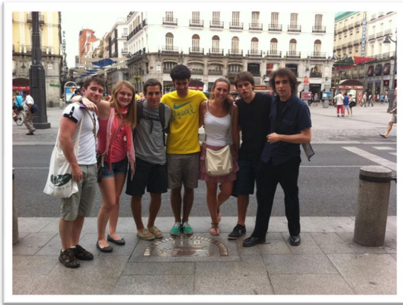
Vam passejar per Madrid i vam anar a dinar pel centre de la ciutat el dia que vam arribar. Aquí som a la Plaza del Sol.

Curtits en discussions i debats per tal d'aconseguir el millor projecte possible, però també reforçats per aquells moments en que les coses sortien bé gairebé sense voler-ho, va arribar l'hora de presentar la nostra proposta als estudis d'Onda Cero. Vam anar a Madrid el 27 de juny , i vam aprofitar per passejar una mica per la ciutat i assajar als estudis. L'endemà vam presentar el nostre projecte.