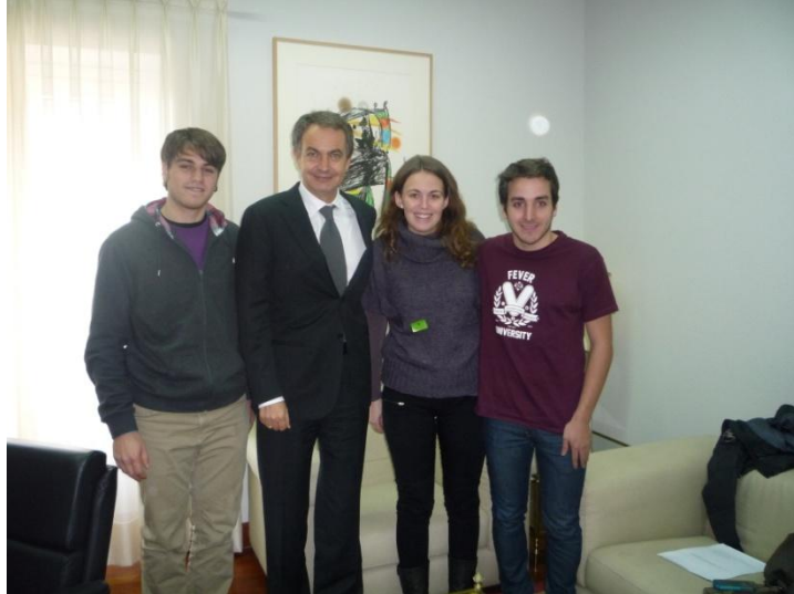
L'entrevista amb José Luis Rodríguez Zapatero, al seu despatx del Consell d'Estat

responsable de les derrotes olímpiques per no haver insistit prou en la tasca de “lobby” que li era encomanada com a president del país. La seva resposta va ser un contundent “No sabía yo que Álvarez del Manzano tuviese tantos conocimientos de política exterior”. La segona hora va ser amb les gravadores apagades, on vam parlar d’aspectes més personals i que no estaven relacionats amb els Jocs Olímpics.