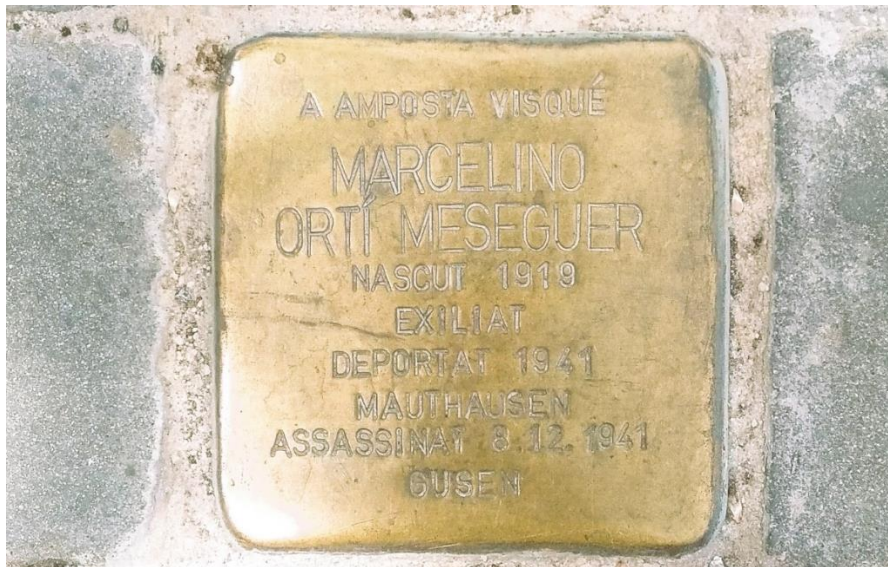
Figura 1. Llamborda stolpersteine a Marcelino Ortí Meseguer del 2021