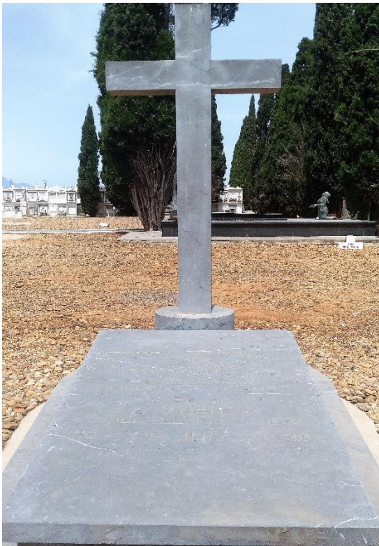
Figura 6. Làpida franquista als màrtirs sobre una tomba del cementiri d'Amposta

https://banc.memoria.gencat.cat/ca/app/#/result/cens_simbologia/3815