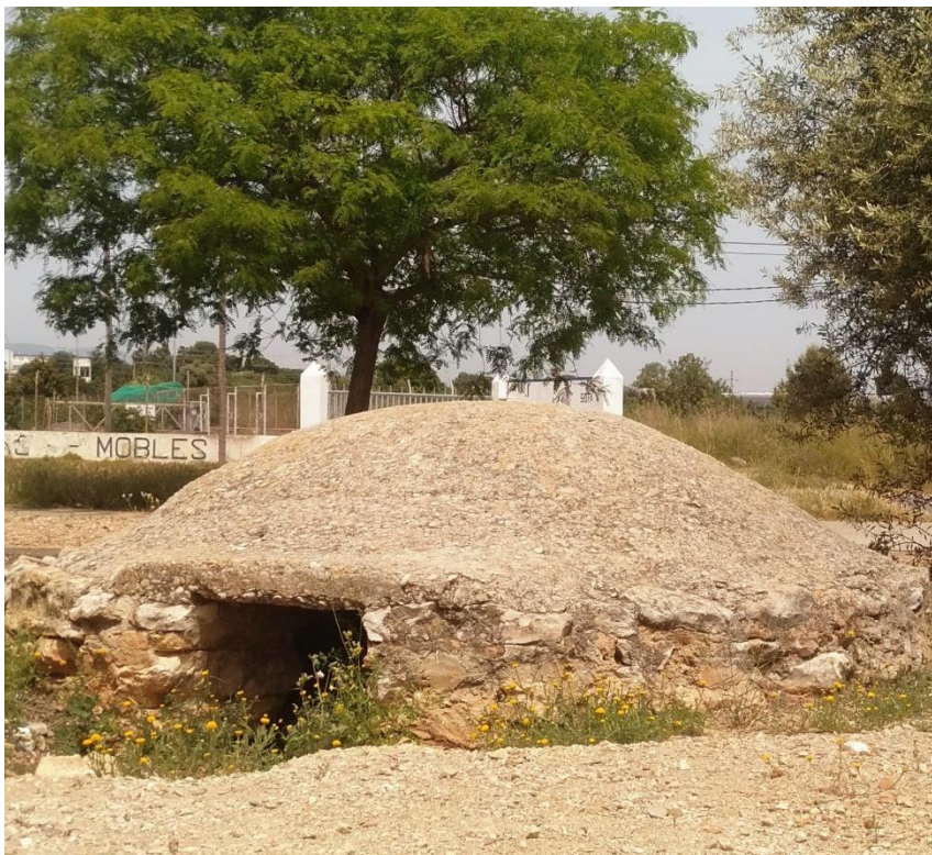
Figura 9. Niu de metralladora a Amposta, entre els carrers de la Mina i de la República.