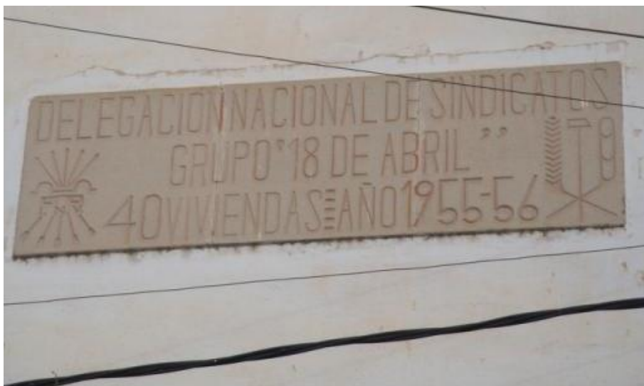
Figura 4. Placa de construcció d'un grup d'habitatges de promoció oficial del 1955 al carrer Melilla. Extret de Retolació de grup d'habitatges 1786, a Banc de la Memòria Democràtica , del Memorial Democràtic, 2021, https://banc.memoria.gencat.cat/ca/app/#/result/cens_simbologia/1786 .