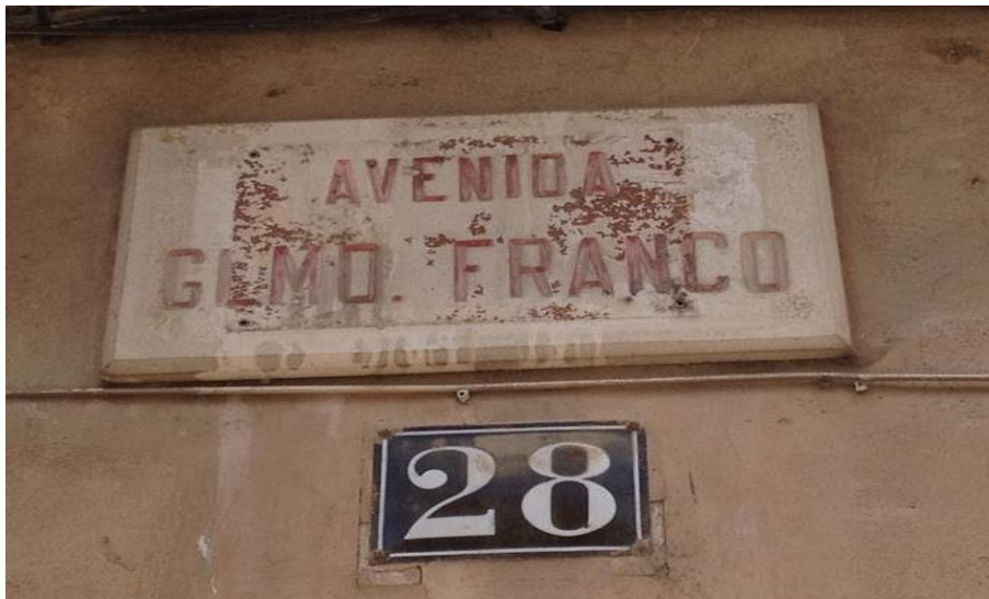
Figura 3. Placa del nomenclàtor franquista de l'avinguda de la Ràpita. Extret de Notícies Ajuntament d'Amposta , de l'Ajuntament d'Amposta, 2016, https://www.amposta.cat/ca/registre/retirada-placa-del-nomenclator-franquista-lavinguda-la-rapita