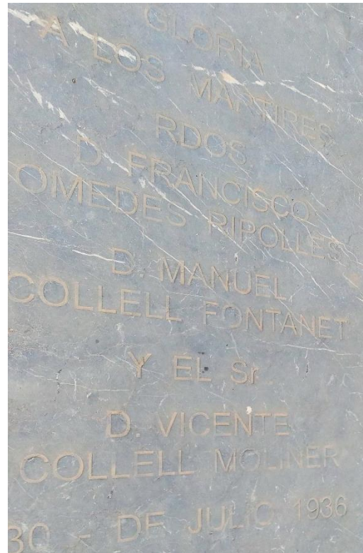
Figura 7. Detall inscripció de la làpida