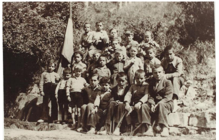
Foto de grup en una de les excursions a la Font del Roc.