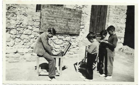
Nens editant la revista amb l'impremta, a l'exterior de l'escola.